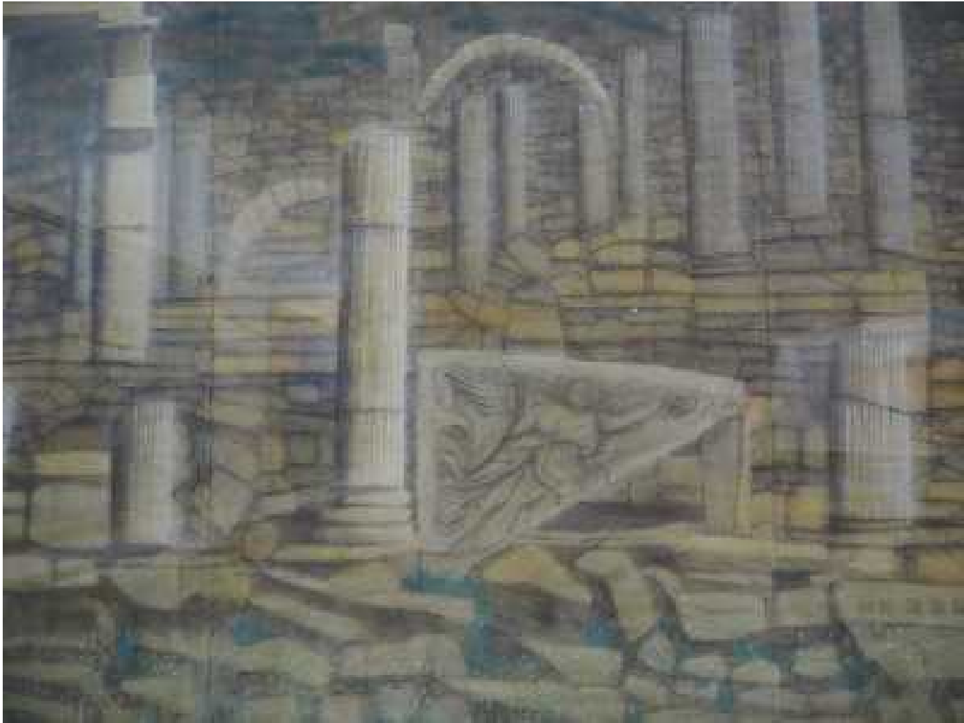
古代ローマ遺跡エフェソス(部分)