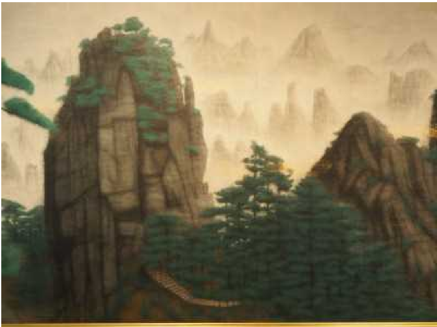
神峰黄山雲海図 左上アップ