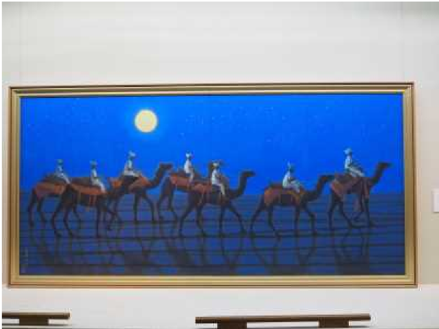
シルクロード行くキャラバン 西・月 2006年