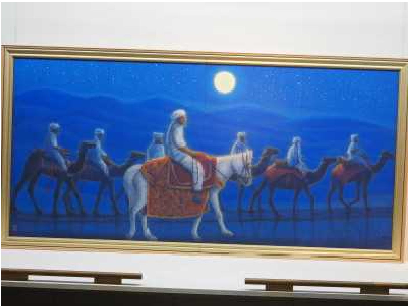
アフガニスタンの砂漠を行く・月 (2007年)