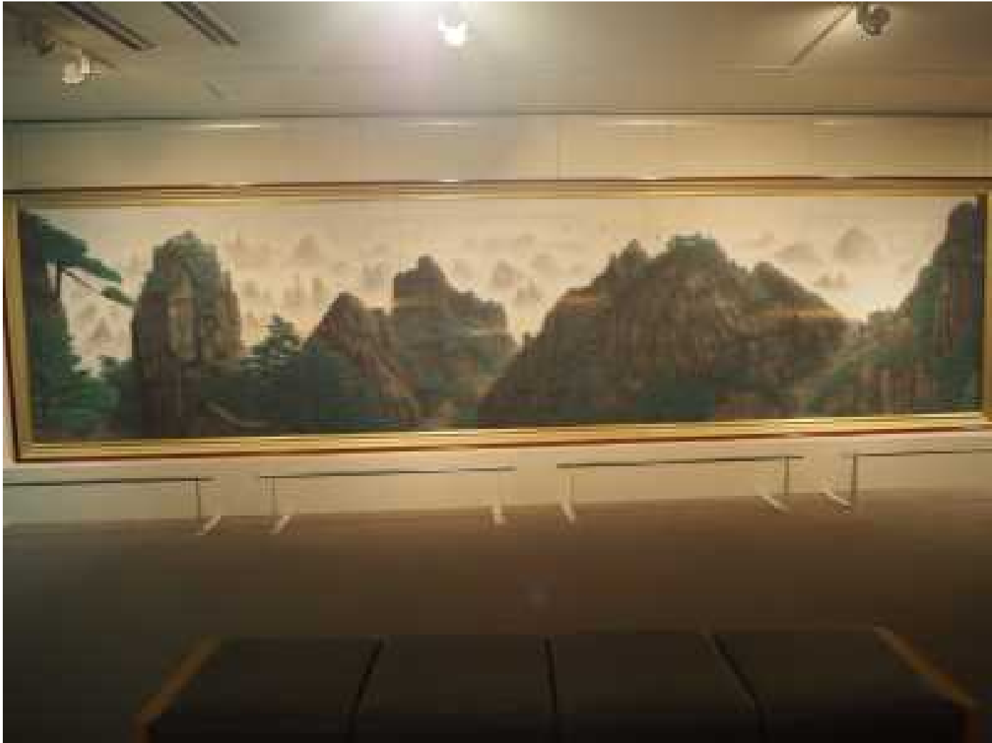
神峰黄山雲海図 全体