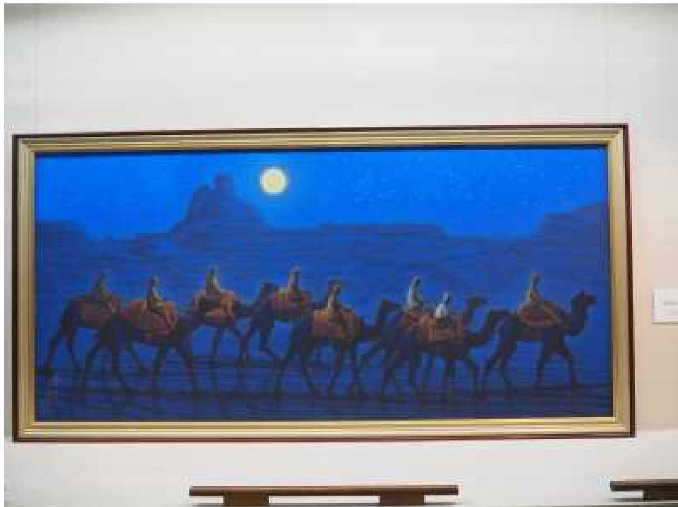
ローラン遺跡を行く 月 2006年