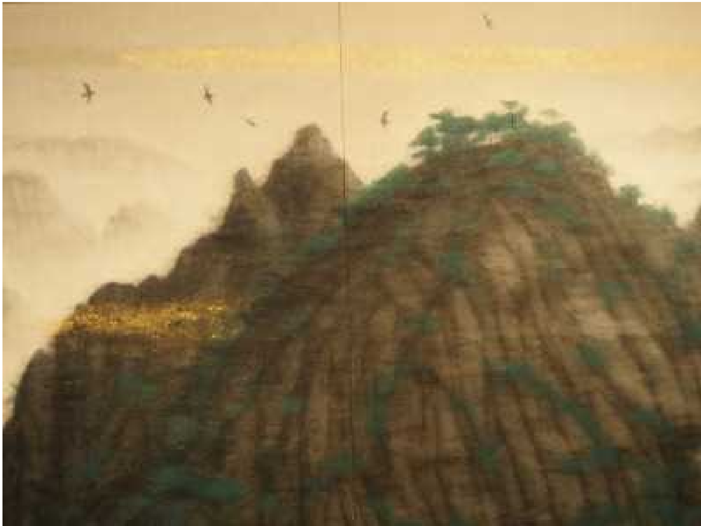
神峰黄山雲海圖 中央右より