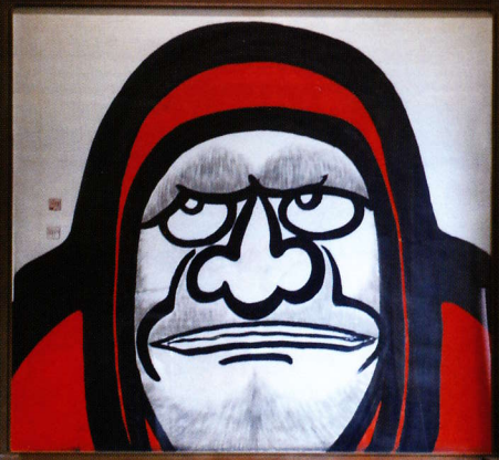
天龍寺派 元管長 関牧翁老師筆・祖師像