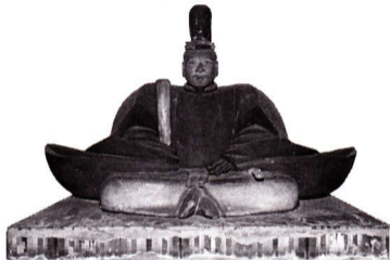
初代将軍 足利尊氏公 木像